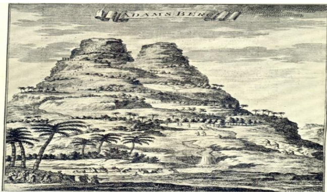
Pilgrims climbing to Adam’s Peak

The attention of the Arabs seems to have been focused on Adam’s Peak around the 8 th century. According to Islamic faith, the foot-print of Adam had been placed in one of the eastern countries, but they had not identified the exact country. Traders sailing in the Indian Ocean were able to see the high mountain in Sarandib, and they heard about the foot-print on the mountain; they began to worship it thinking that it was the foot print of Adam. In most of the Arabic and Persian records and old writings, whenever they mentioned Sarandib, they never missed mentioning Adam’s Peak.